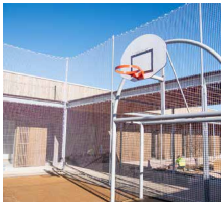
Le plateau sportif intégré dans l'enceinte.